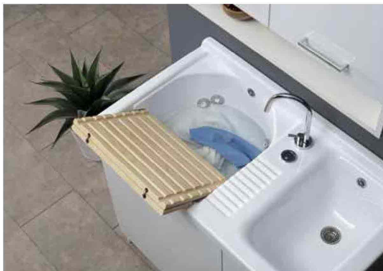
Lavatoio automatico Active Wash da 100 cm

Colavene propone una combinazione dell'antico lavatoio con la tecnologia innovativa Active Wash. Viene definito un prodotto ibrido perché la capiente vasca da 25 litri dispone di 4 bocchette idromassaggio che, con una duplice azione di aspirazione e spinta, muovono i capi delicati in un movimento a vortice, senza rovinare le fibre. Si tratta di un ammollo evoluto per seta e lana, a cui far seguire un risciacquo a mano o automatico. Il ciclo di lavaggio dura un'ora e consuma 0,58 kWh.